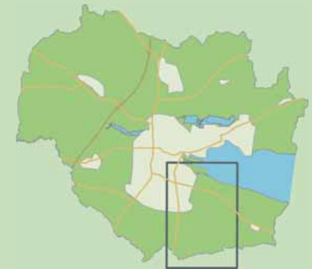
Horsens Kommune Boller og Bjerrelide ruterne.