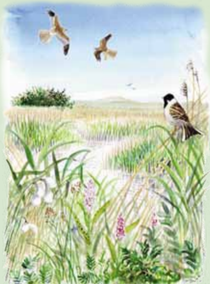
Rørhøg og Rørpurv

Du må tage din hund med, hvis den er i snor.