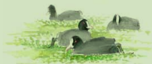
Blishøns i andemad

Under "kort" på Horsens Kommunes hjemmeside, kan man på webkortet med laget for Friluftsliv slået til, se beliggenhed, tekst og fotos på Horsens Kommunes informationsskilte om stryg, fugle, fisk, for-tidsminder og planter i parken.