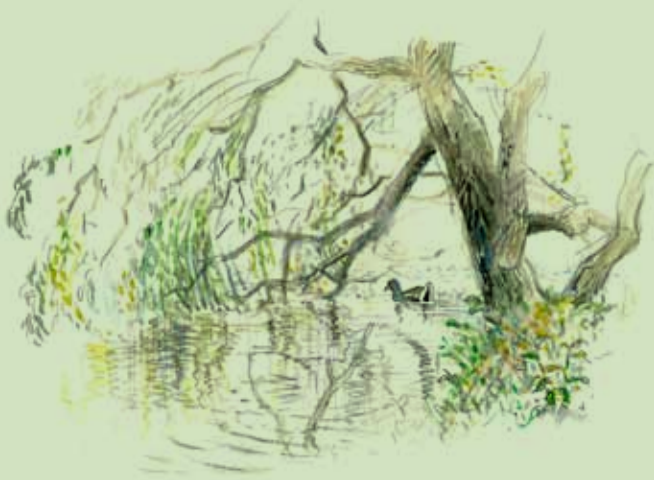
Rørhøne ved hængepil

I parken findes store flokke af gæs og ænder. Også blishøns, rørhøne og mange sangfugle ynder at opholde sig i parken. Lige øst for Bygholm Å tæt ved Peblingestien er der nogle år en koloni af hejrer. Flere og flere skarver er begyndt lejlighedsvist at opholde sig på øerne i de største søer i parken. Gæs og ænder er så talrige, at Horsens Kommune i nogle år har reguleret andebestanden ved indfangning – da der blandt ænderne har været mange fejlfarver, og fuglene har nået et sådant antal at de forurener parken og dens vandmiljø.