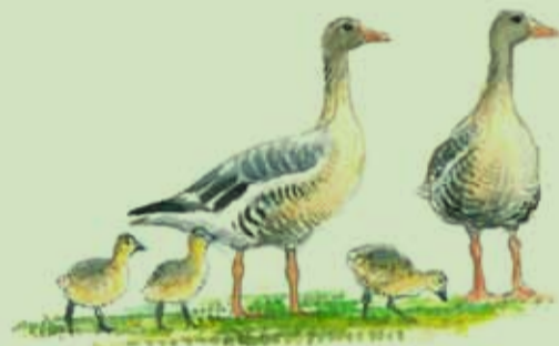
Grågæs med gæslinger

Øst for stryget lå i perioden 1935-41 en lille zoologisk have.