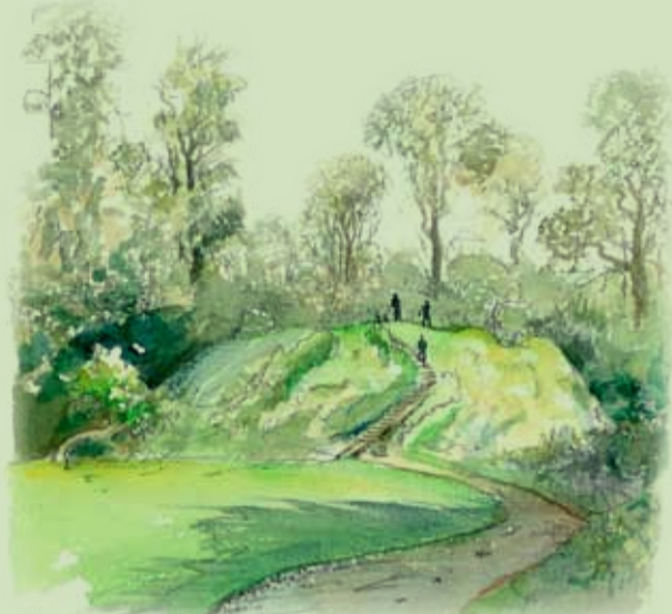
Slangebjerget og Ladegårdsplads

Slangebjergget har sit navn efter den snoede adgangsvej rundt om holmen.