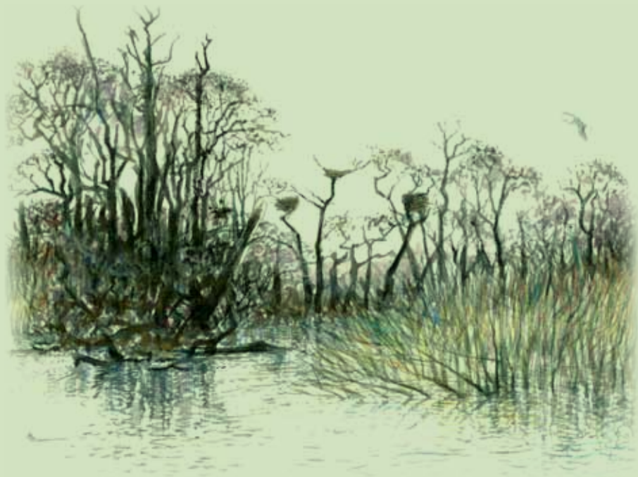
Hejrekoloni ved Bygholm Å

Toilet findes i parken og er åbent i sommerhalvåret fra ca. kl. 8 til 19.