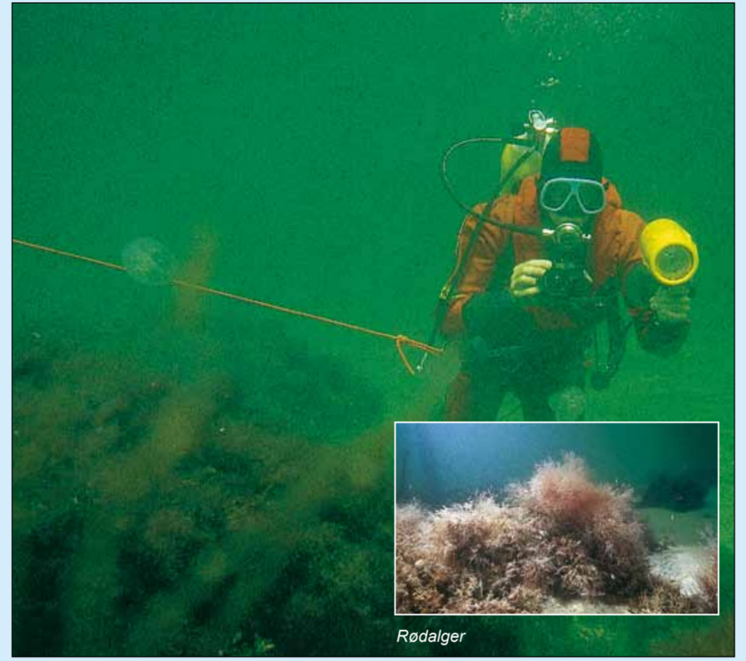
I farvandet syd og øst for Endelave er der flere stenrevsområder med spændende algebevoksninger. Farvandet her rummer derfor oplagte udflygtsmål for sportsdykkere.

Vandet omkring Endelave er meget klart og uden misfarvninger af opblomstrende alger. Der findes mange forskellige arter af bundplanter, og på grund af det klare vand vokser de på selv store dybder.