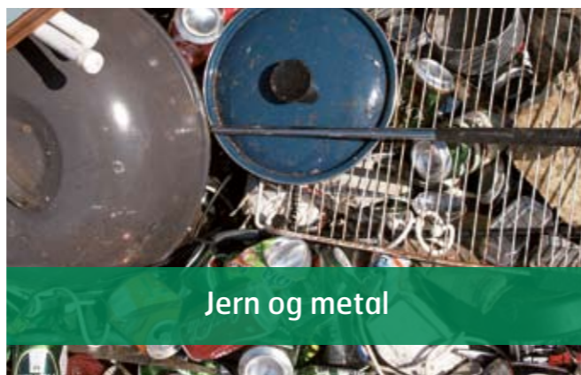
Jern og metal